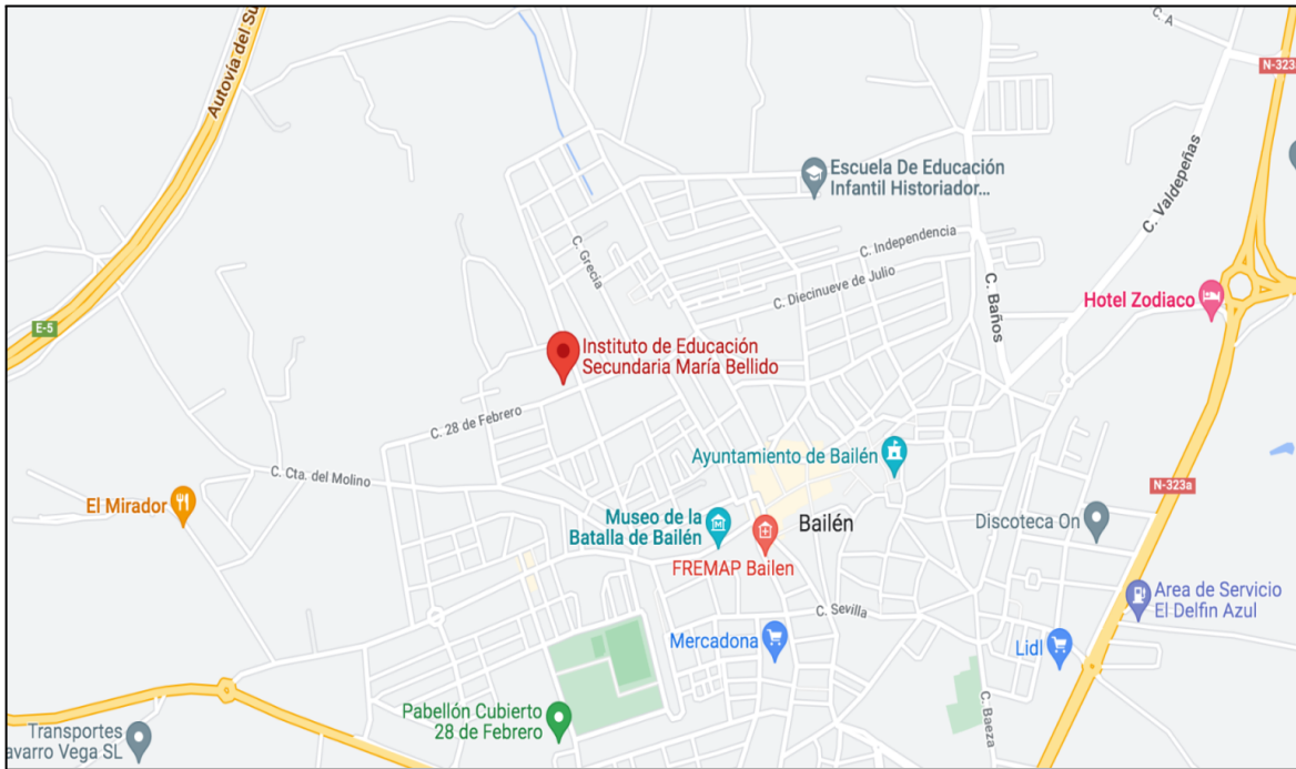
Ilustración 4: Ubicación del IES María Bellido