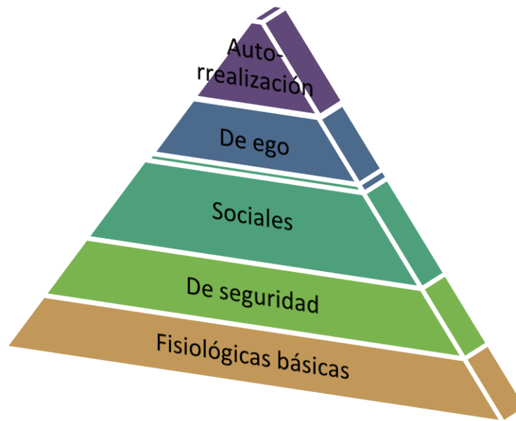
Figura 1: Pirámide de necesidades de Maslow.