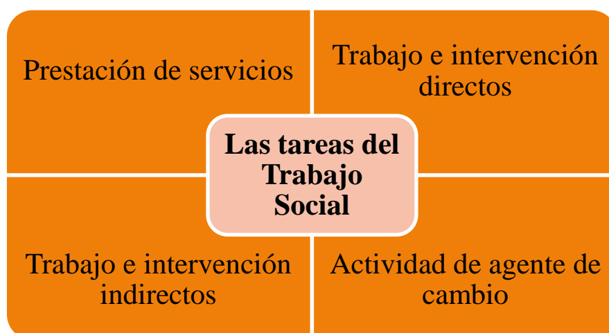
Figura.4: Matriz de las tareas del Trabajo Social