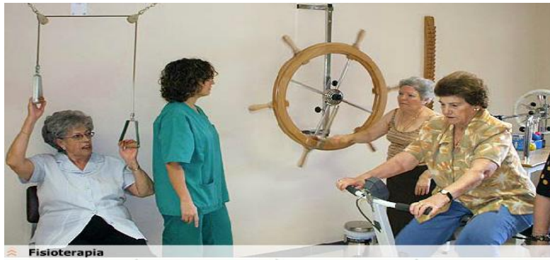
Figura 11 Fisioterapia