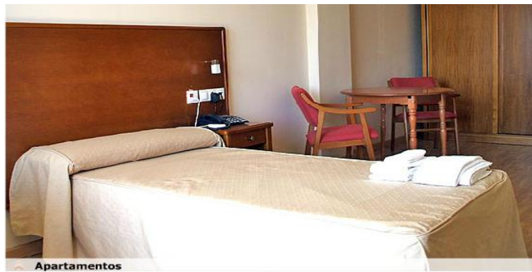
Figura 16 Apartamentos