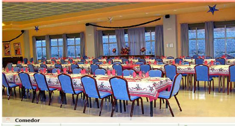
Figura 8 Comedor