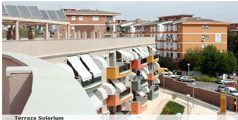
Figura 2 Terraza solarium