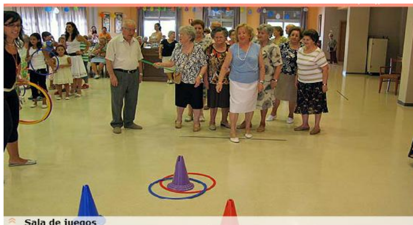
Figura 4 Sala de juegos