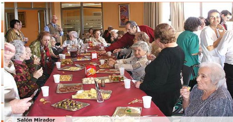
Figura 7 Salón mirador