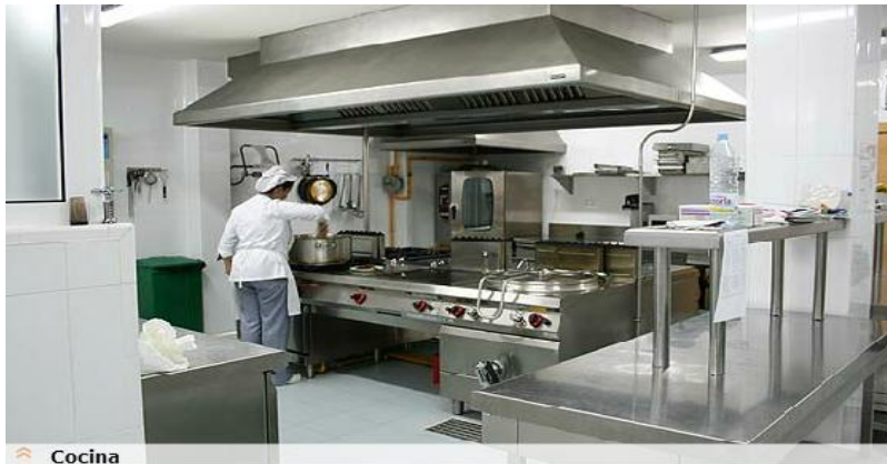
Figura 6 Cocina