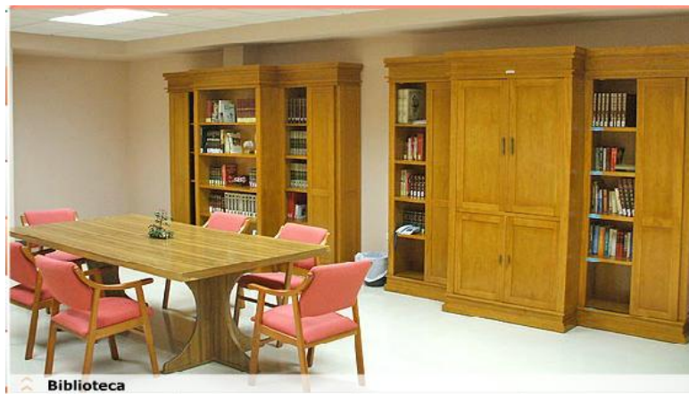
Figura 10 Biblioteca