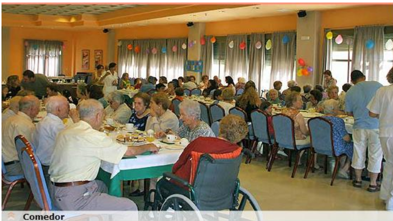
Figura 9 Comedor