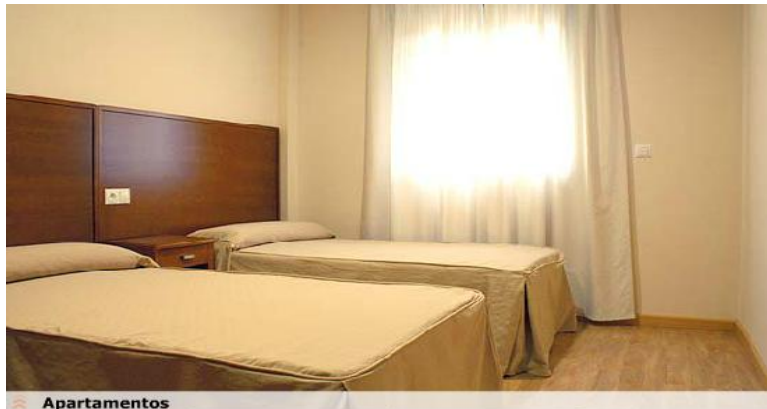
Figura 15 Apartamentos