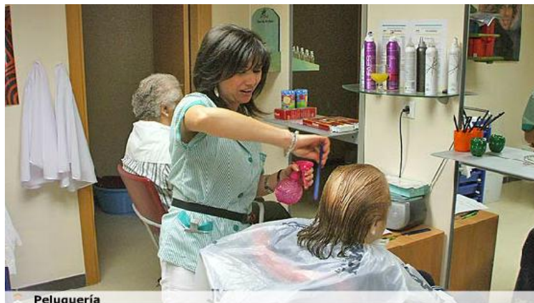
Figura 13 Peluquería