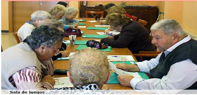
Figura 5 Sala de juegos