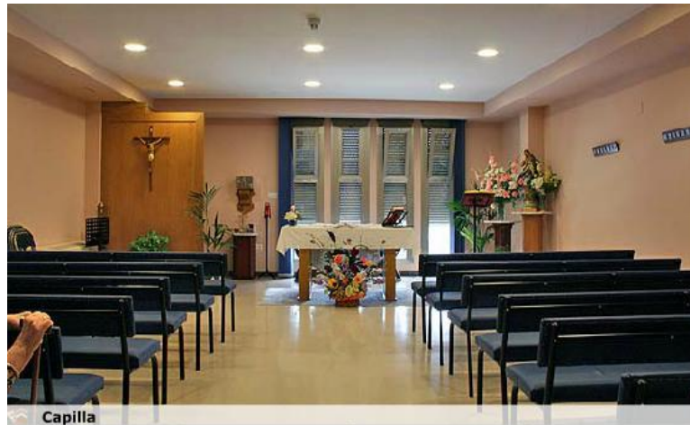
Figura 12 Capilla