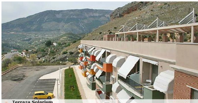
Figura 3 Terraza solarium