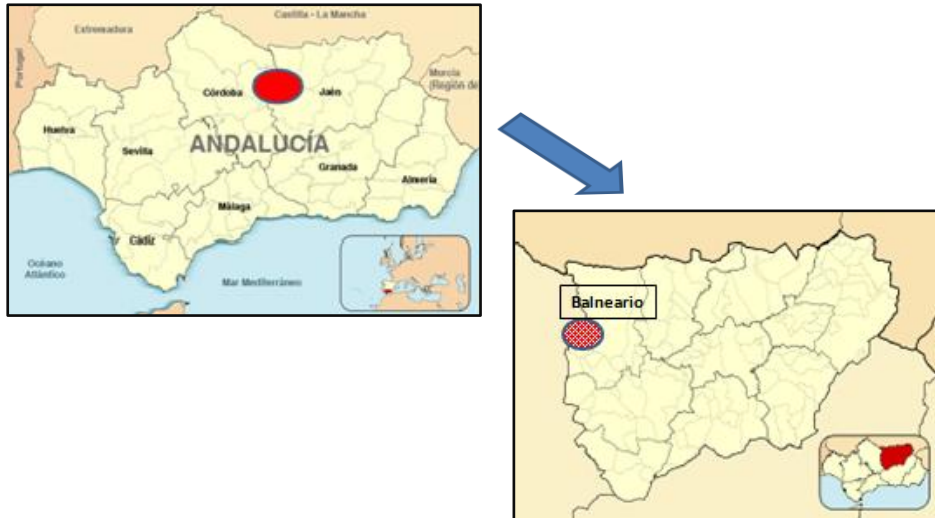
Mapa 1. Localización del área de estudio y ubicación del balneario.