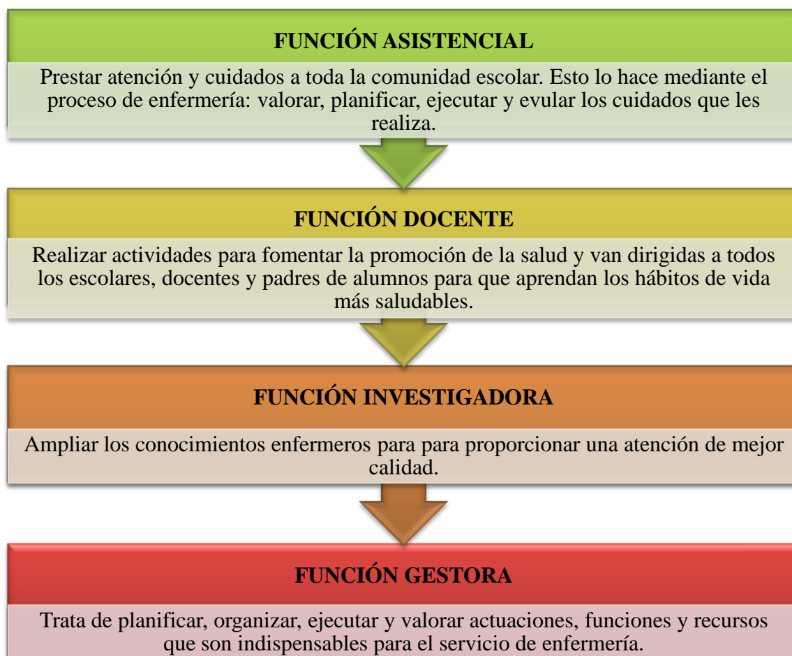
Tabla 4. Funciones de la Enfermera Escolar según la SCE en España.

En España, las funciones de la Enfermera Escolar son según dice la Sociedad Científica Española de Enfermería Escolar (SCE): (15) (19)