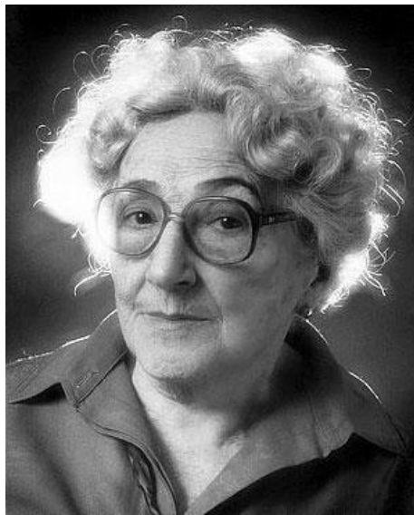
Fotografía 5: Rosa Chacel

Rosa Chacel Arminón (1898-1994) fue una mujer excepcional, que se dedicó a la novela en un tiempo en el que era difícil incorporarse a un panorama cultural como mujer novelista, así mismo, también hizo poesía, ensayos, y críticas. No consideraba que su posición como mujer fuese una barrera y por eso se atrevió a derribarlas para poder dedicarse a lo que verdaderamente le hacía sentirse viva.