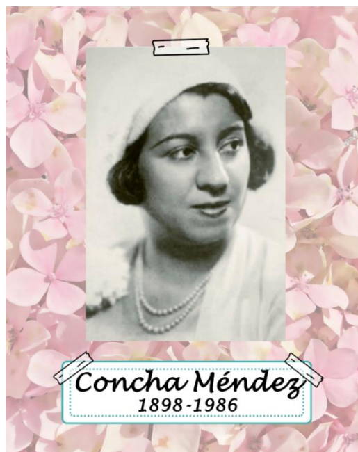
Ilustración 1: Portada

En el caso de que no les diera tiempo, tendrán que terminarlo en casa. Un ejemplo de la publicación sería el siguiente: