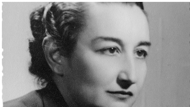
Fotografía 4: Ernestina Michels de Champourcín

Ernestina Michels de Champourcín y Morán de Laredo (1905-1999) fue una poeta española, moderna y transgresora, cuyo lugar en la nómina del 27 es innegable, siendo reconocida incluso por Gerardo Diego, que la incluyó, junto a Josefina de la Torre, en la segunda edición de la antología Poesía española contemporánea .