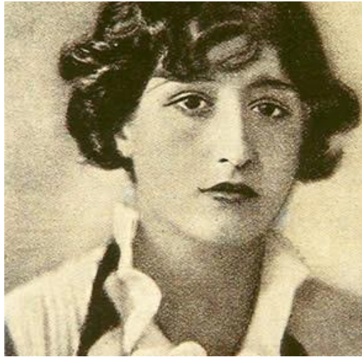
Fotografía 2: Maruja Mallo