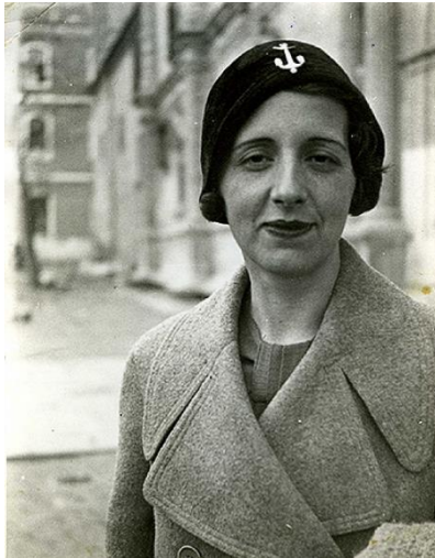
Fotografía 3: María Zambrano

María Zambrano (1904-1991) fue la primera mujer en recibir el premio Cervantes, además de numerosos homenajes y condecoraciones.