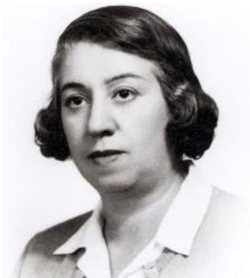
Fotografía 1: Concha Méndez

Concepción Méndez Cuesta (1898-1986) fue una mujer excepcional con muchos sueños y rebeldía para conseguir aquello que por derecho era suyo. Perteneciente a una familia adinerada, luchó por alcanzar el desarrollo intelectual que tanto anhelaba pese a la imposición de una familia que le negaba una educación superior.