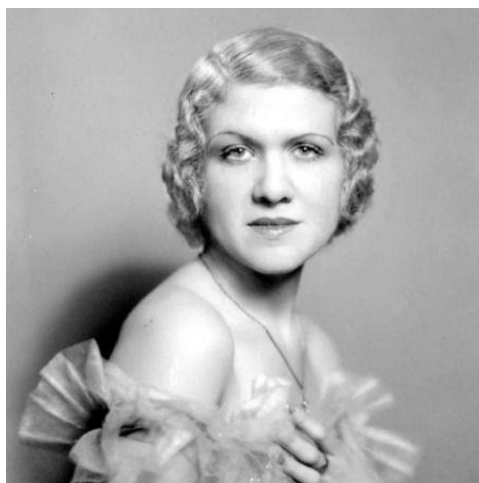
Fotografía 8: Josefina de la Torre

Josefina de la Torre Miralles (1907-2002) fue una mujer polifacética: poeta, novelista, cantante, compositora, actriz de doblaje, columnista, guionista y además, la única actriz de toda la generación del 27.