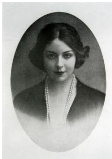
Fotografía 7: María Teresa León

María Teresa León Goyri (1903-1988) escritora, ensayista, dramaturga, guionista, periodista, feminista y activista”.