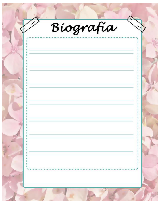
Ilustración 2: Biografía